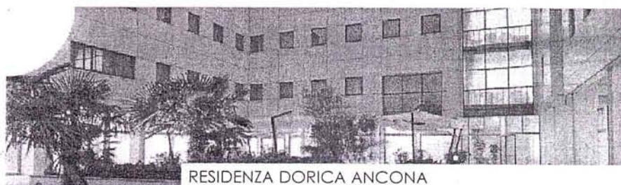
RESIDENZA DORICA ANCONA